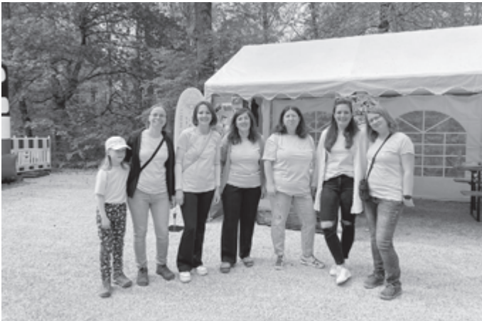
Euer FFS Vorstand

Hierfür könnt ihr Euch schon einmal den Samstag, 13. Juli 2024 ab 14 Uhr vormerken. An diesem Tag ist ein Spielplatzfest in Udingen geplant.