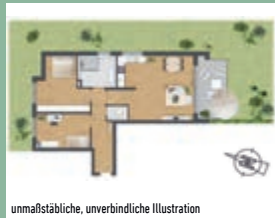
unmaßstäbliche, unverbindliche Illustration

ca. 88 m 2 Wfl., EG, 435.000,- €, provisionsfrei